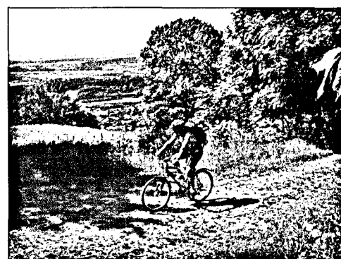
21 Outdoor Mountainbiken im Oberaargauer Jura