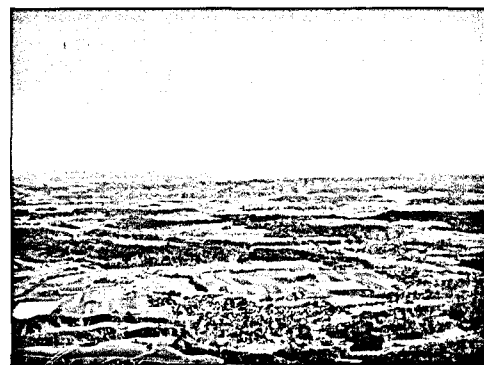
4 Oberaargau Land zwischen Napf und Jura