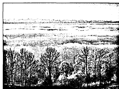
40 Portfolio «Oberaargau» von Samuel Sommer